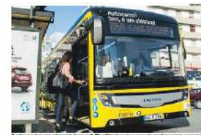
Nas ruas de Lisboa já circula um autocarro movido a electricidade