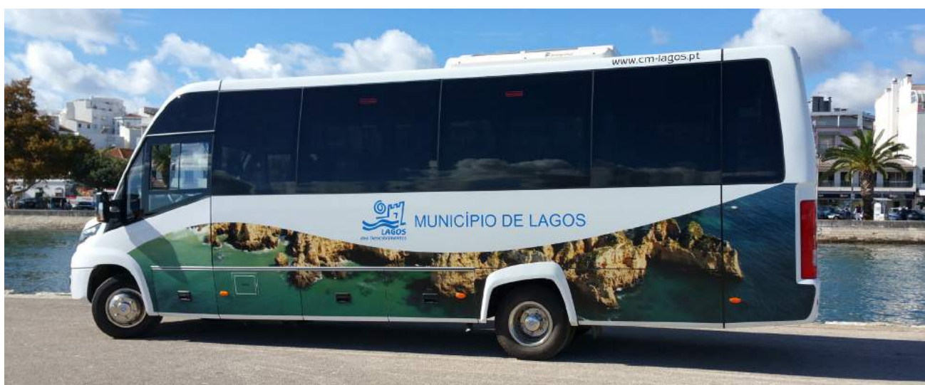
Entrega do iTrabus S33 ao Município de Lagos