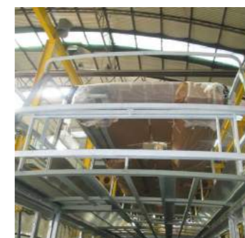
5. O tejadilho é montado no autocarro.