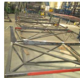
1. Desenvolvimento de um gabarit para montagem completa do tejadilho.