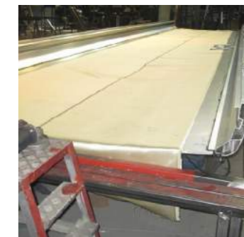
3. São colocadas as sancas e fixadas as condutas.