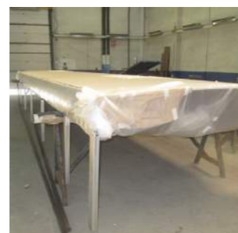
4. Por último são fixados os pilares.