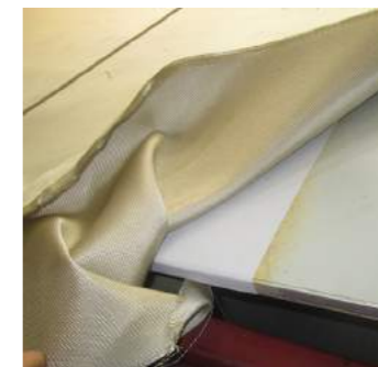
2. Montagem do compósito no gabarit, sendo forrado com napa.